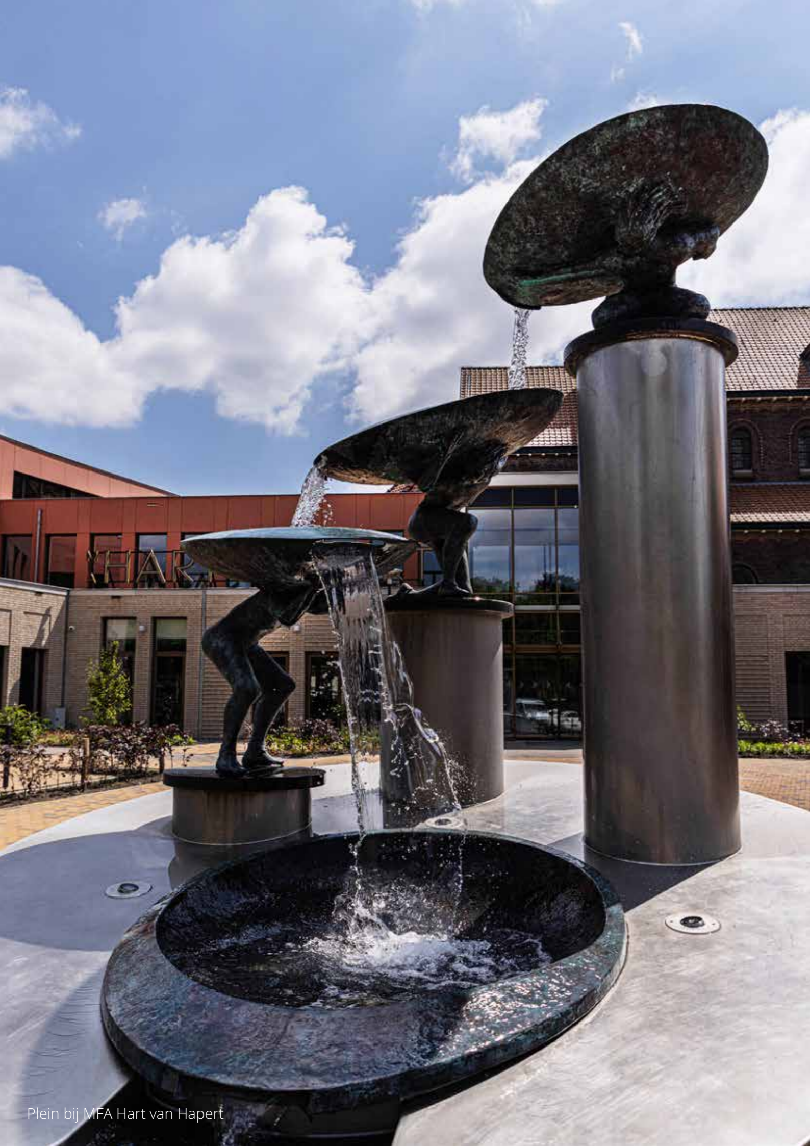
Plein bij MFA Hart van Hapert