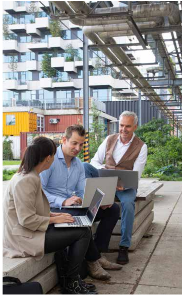
Snelders Consulting Markt 1 Hapert www.sneldersconsulting.nl

Of het nu gaat om het verzorgen van financiële overzichten, belastingadvies of begeleiding bij strategische besluitvorming, Snelders Consulting staat bekend om de toewijding aan het succes van onze klanten. Onze rol als vertrouwde adviseur en partner heeft ons een gewaardeerde positie gegeven binnen de lokale zakelijke gemeenschap. Bij Snelders Consulting ligt de focus op 'werken aan het bedrijf', meer dan 'werken in je bedrijf'; een subtiel maar belangrijk verschil in visie." Behoeft u financieel advies of sparren met een ervaren consultant? Neem gerust contact op, we kijken graag met je mee.